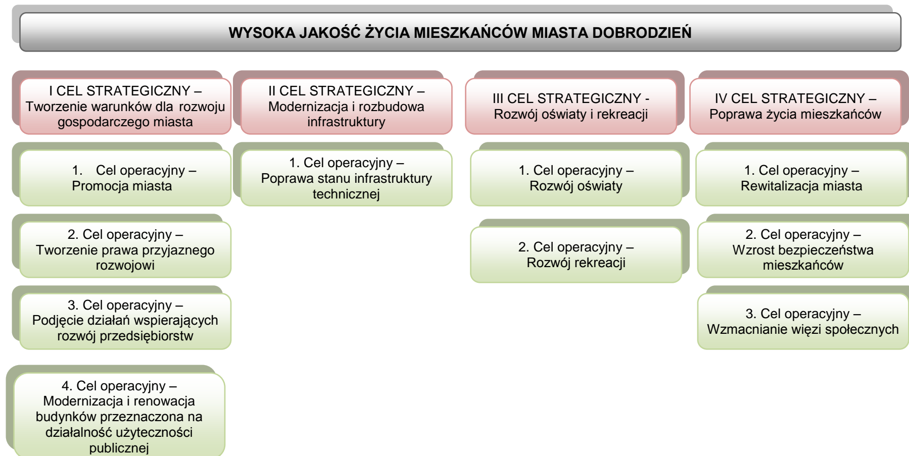
Tabela 4. Wyznaczone cele strategiczne dla miasta Dobrodzienia.