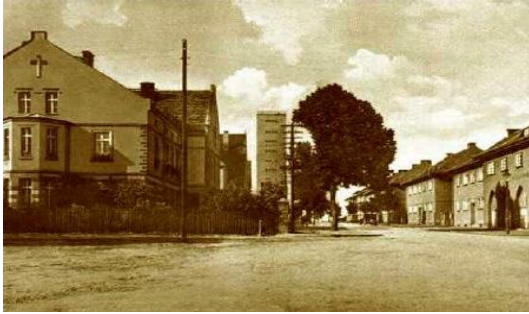
Rysunek 3. Ulica Oleska około roku 1936. Po lewej budynek szpitala w Dobrodzieniu.

Z inicjatywy saksońskiej królowej Karoli wybudowano w Dobrodzieniu w 1898 r. nowy szpital, który na cześć „anioła ubogich” nazwano „Zakładem królowej Karoli”. W 1919 r. król Fryderyk August sprzedał część dóbr państwu i osobom prywatnym, a na podstawie prawa pruskiego z 27 grudnia 1927 r. majątek dobrodzieński został nabyty przez państwo niemieckie. Dla uczczenia mężczyzn, poległych w I wojnie światowej w latach 1914 – 1918, miasto ufundowało pomnik z brązu (zachowany jedynie na fotografiach).